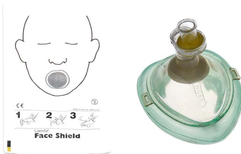
Face shield, pocket mask

Mențiune referitoare la siguranța procesului de învățare în resuscitare: nu există nici un caz de boală transmisă prin folosirea manechinelor sau materialelor de instrucție; se recomandă totuși luarea unor măsuri de precauție, pentru limitarea riscului de îmbolnăvire, cum ar fi: curățarea, cu substanțe speciale, după fiecare utilizare a materialelor de lucru, utilizarea de piese detașabile faciale și de cale respiratorie care pot fi ușor înlocuite și curățate.